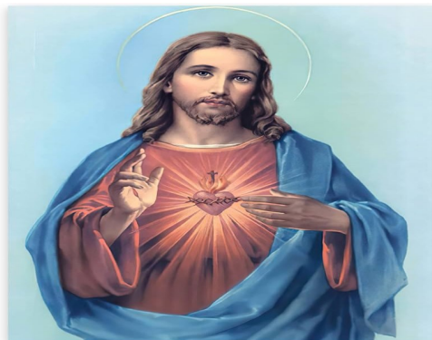
EL SAGRADO CORAZON DE JESUS